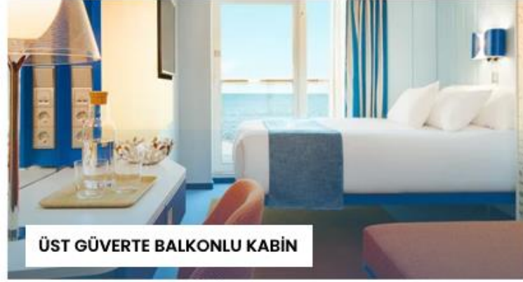
ÜST GÜVERTE BALKONLU KABİN

Kabin Özellikleri: İki adet tek kişilik yatak veya bir büyük yatak, özel banyo ve duş, minibar, televizyon, telefon, saç kurutma makinesi ve kasa. Klasik kabinler geminin ilk güverte üzerinde yer almaktadır.