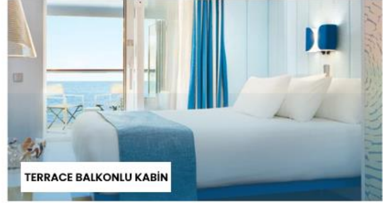
TERRACE BALKONLU KABİN

Not: Sigara içilmesi kabinlerde yasaktır, ancak kül tablaları kullanılması durumunda balkonlarda izin verilir.